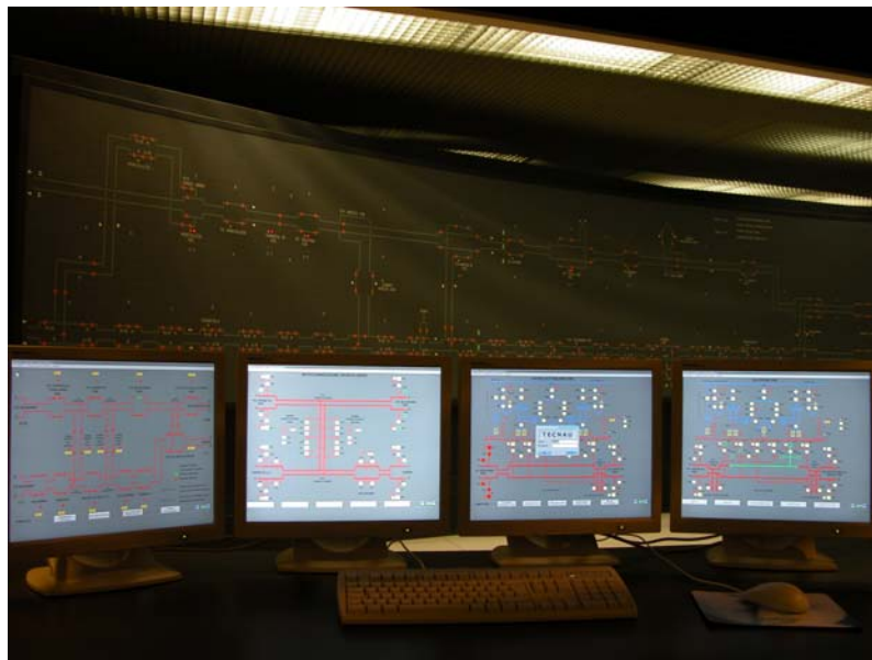
Fig. 1 - Pulpito di comando del sistema SCTE presso RFI Firenze Campo di Marte

permettere l'inserimento in telecomando dei posti periferici compresi nelle tratte Chiusi(e) – Attigliano(e) della linea Firenze - Roma LL e Montallese(e) – Bassano(e) della linea Firenze - Roma DD, sotto la giurisdizione del compartimento di Firenze.