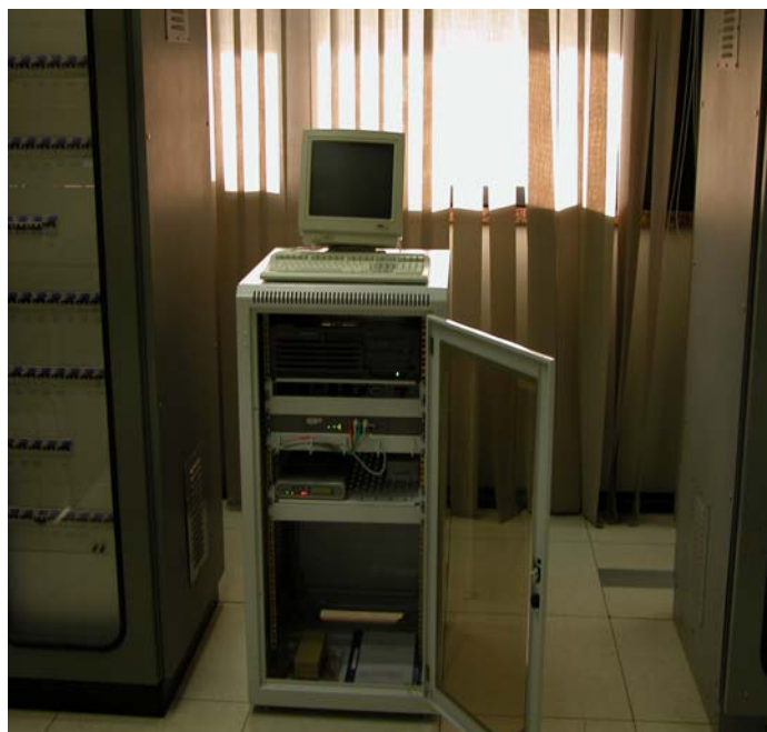
Fig. 5 – Armadio TecnaU

Conclusioni. In conclusione possiamo dire che la collaborazione tra i tecnici RFI del compartimento di Firenze e quelli della TECNAU s.r.l., ha portato in brevissimo tempo alla realizzazione di un sistema di telecontrollo TE che soddisfa ampiamente il cliente.